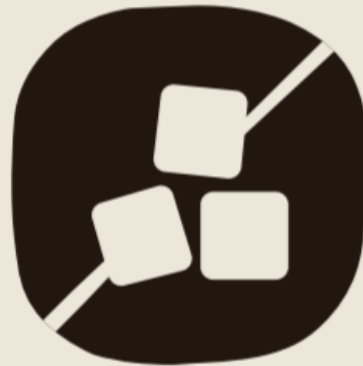
No added sugar